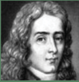
Edme Mariotte 1620-1684

Le physicien et botaniste français Edme Mariotte, un pionnier de la physique expérimentale en France, est surtout connu pour ses travaux sur la reconnaissance, en 1676, de la loi de comportement élastique des gaz formulée indépendamment par Robert Boyle qui a obtenu cette loi en 1662.