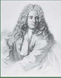
Pierre-Louis de Maupertuis 1698-1759

Le mathématicien Pierre-Louis de Maupertuis est devenu célèbre grâce à son expédition en Laponie dont les résultats ont permis de trancher le débat sur la forme de la Terre. En 1740, il présente à l'Académie sa « loi du repos des corps » qui est un principe de minimisation de l'action des forces dans un système en équilibre.